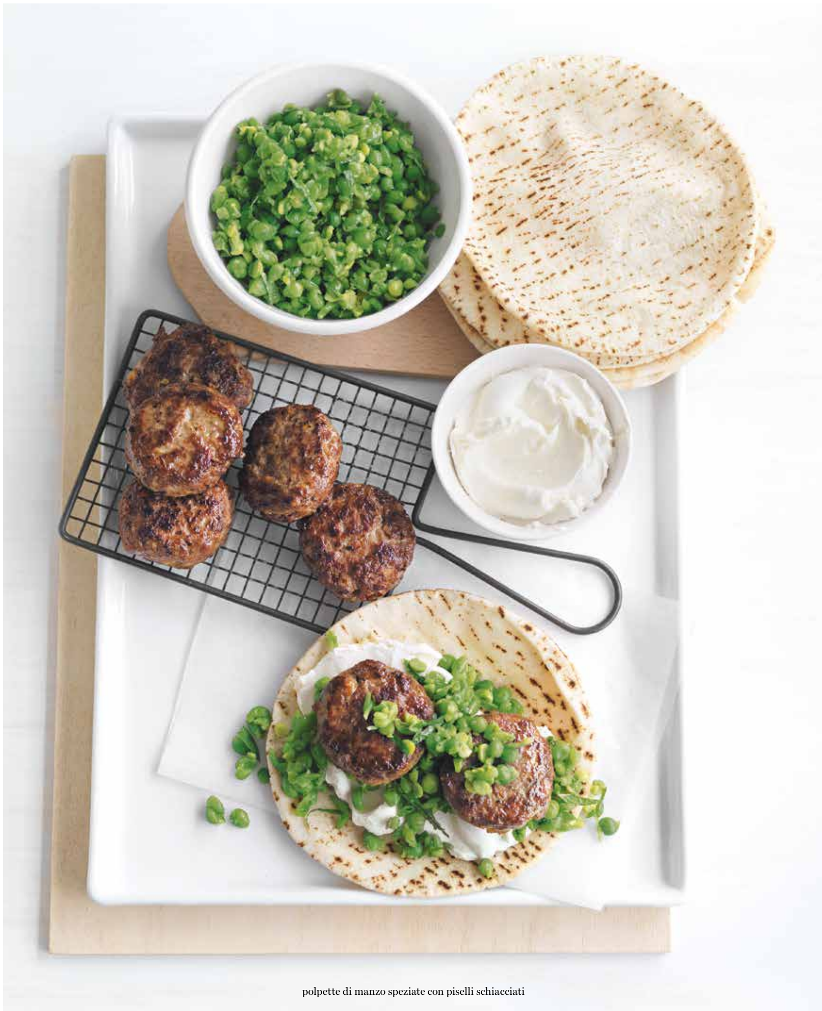
polpette di manzo speziate con piselli schiacciati