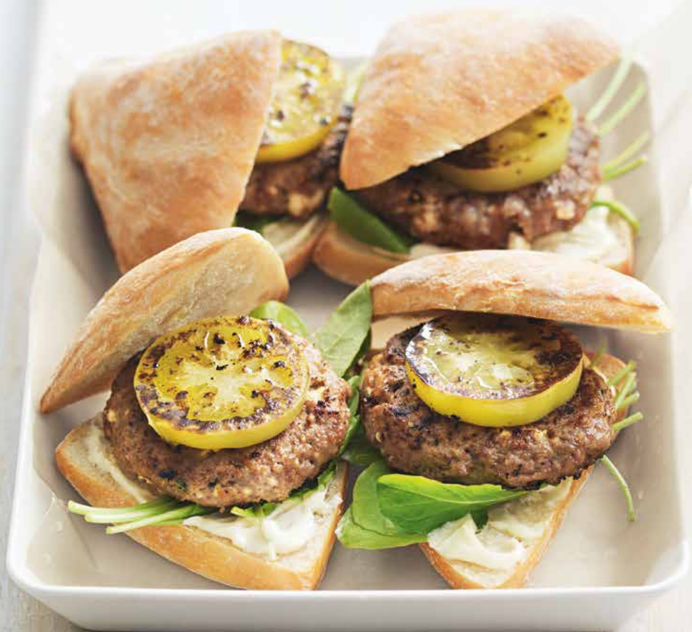
hamburger di agnello e feta

Non è il classico hamburger. I pezzetti di feta fusa all'interno gli danno una marcia in più.