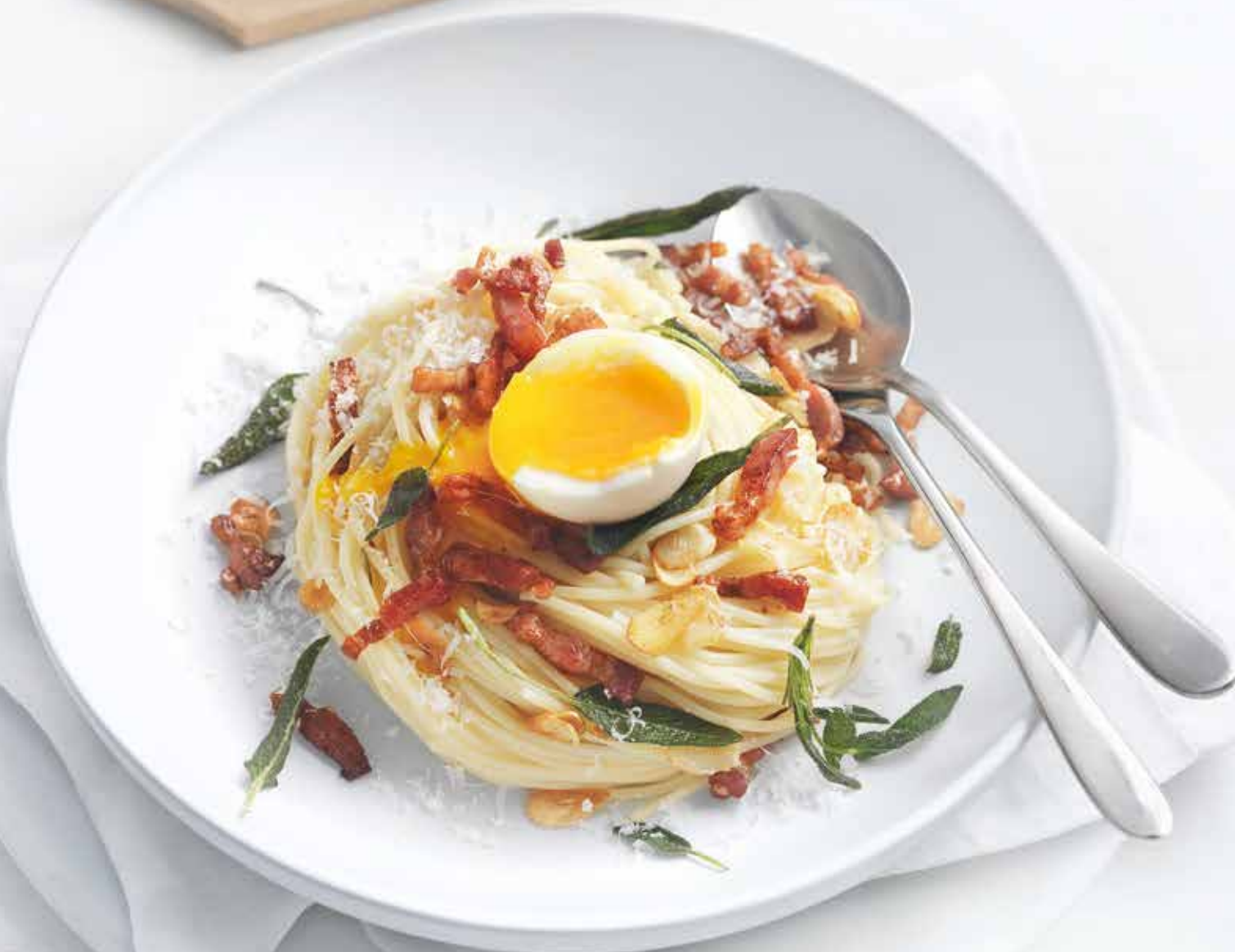
pasta con uovo morbido e pancetta croccante

Il tuorlo crea all'istante una salsa cremosa per la pasta e si sposa a meraviglia con la pancetta.