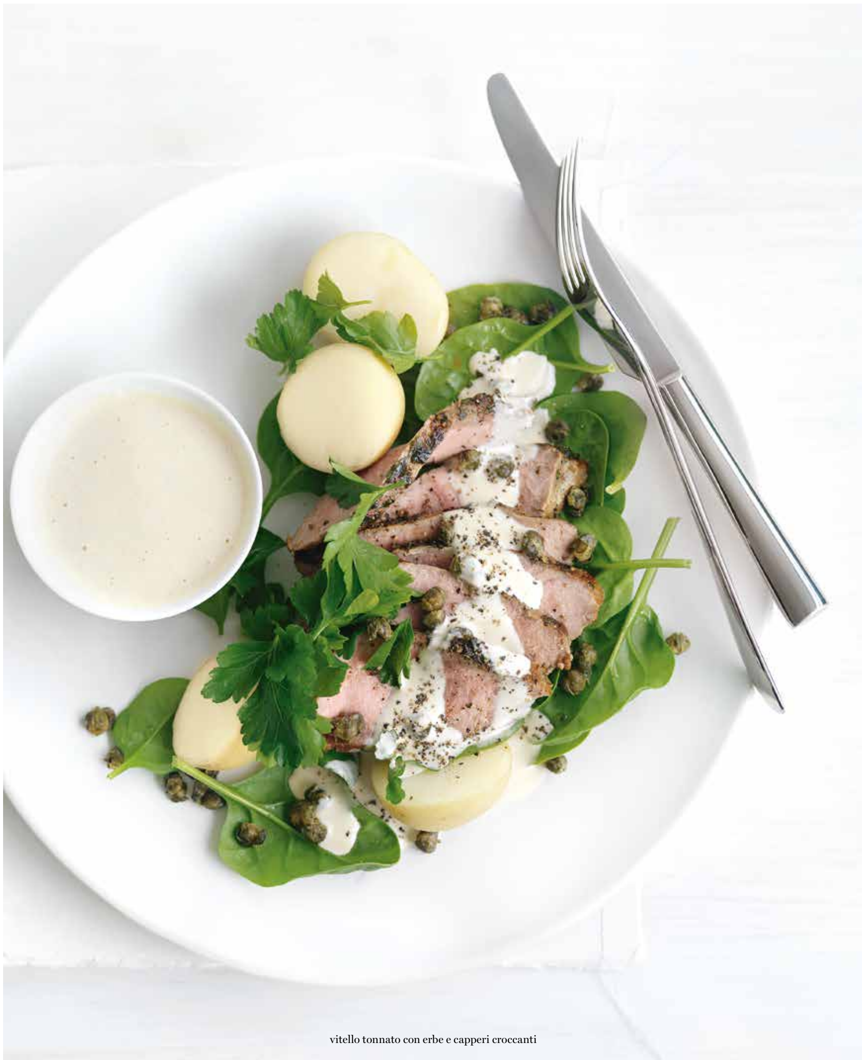
vitello tonnato con erbe e capperi croccanti