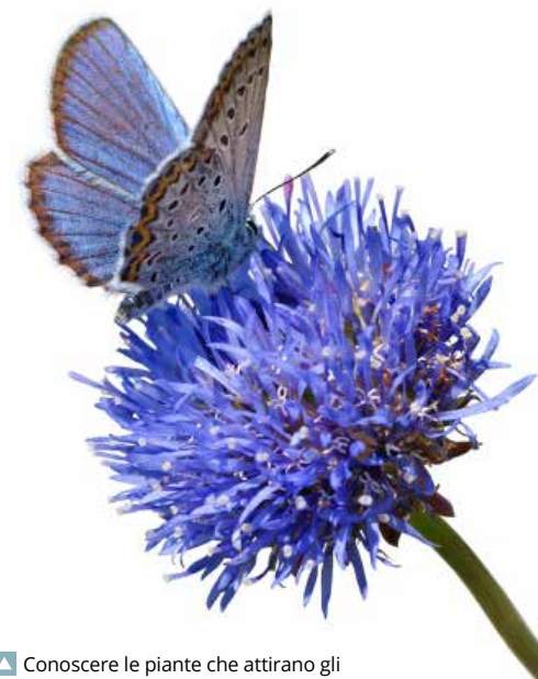
Conoscere le piante che attirano gli impollinatori vi aiuterà ad abbellire il giardino. Quelle del genere Allium donano belle macchie di colore e attirano le farfalle.

Il box 'R' sotto a ogni domanda vi dà la risposta rapida nel modo più sintetico possibile. Leggete però anche il testo principale, che fornisce anche il contesto e tanti dettagli in più.