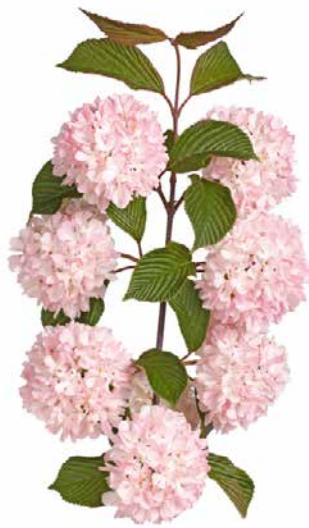
Viburnum plicatum f. plicatum 'Rosace'

PERCHÉ LA MIA ROSA , che il primo anno è fiorita bene, si è spostata dall'altro lato della recinzione? Adesso i passanti si godono i fiori, mentre nel giardino non ce ne sono.