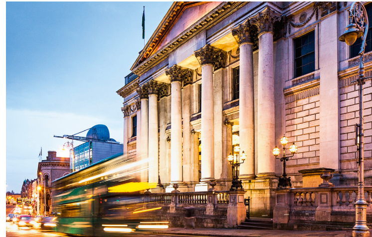
Dublino è una città piena di contrasti affascinanti: il moderno incontra il tradizionale, l'internazionale si fonde con l'anima profondamente irlandese.

Parlando di paesaggio urbano, negli ultimi anni a Dublino sono cambiate molte cose. Accanto a strade storiche ben conservate (o restaurate), spiccano architetture firmate da Libeskind; le Docklands, un tempo fatiscanti, sono impreziosite da nuovi edifici imponenti; tra street art e installazioni autorizzate si compone un quadro urbano vivace e colorato. Così moderno, spontaneo e variopinto che ormai persino il quartiere culturalmente più