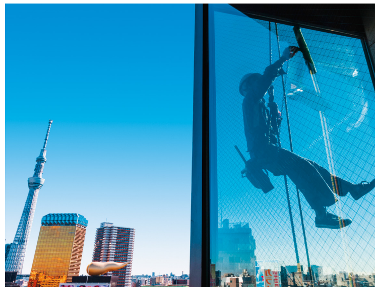
Vista sulla Tokyo Skytree con il grattacielo di Asahi e La Flamme d'Or

Chi è stato a Tokyo almeno una volta finisce per tornarci. È difficile spiegarne il motivo: credo che sia perché la città è così incredibilmente varia che ognuno può trovarci qualcosa di interessante. In continuo mutamento, c'è sempre qualcosa di nuovo da scoprire e da vivere, tra cui molte mostre d'arte di altissimo livello su quasi ogni tema. Altri sono attratti dalla vita notturna o dagli eventi della moda, dalle infinite possibilità offerte per lo shopping o dalla rete praticamente perfetta del trasporto pubblico che rende possibile pianificare in tempo reale ciò che si desidera fare in città.